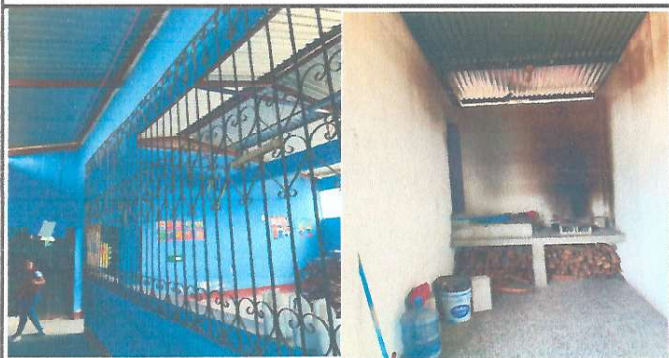
Foto 5: Necesidad de instalar Ventanas en Modulo 2 de aulas y remozar con Extractor de humos y area de polletón en Cocina.