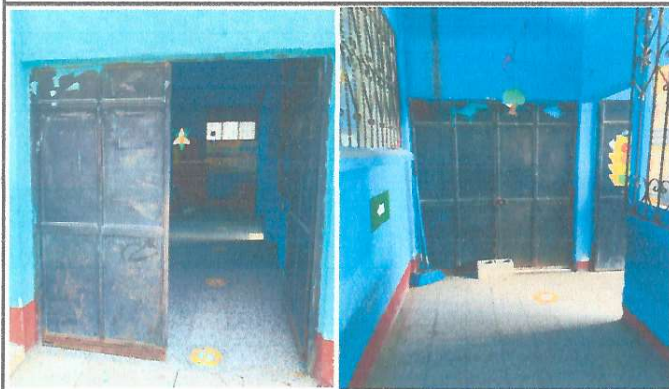
Foto 3: Necesidad de mejoramiento de 2 portones de ingreso al plantel.