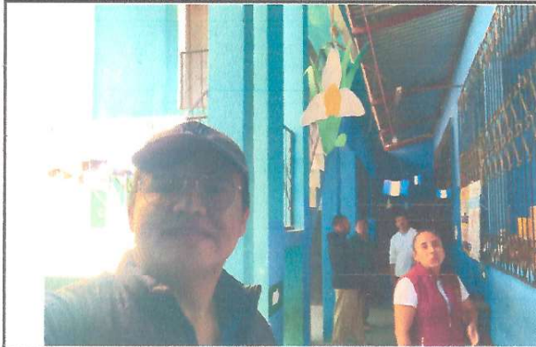
Foto 1: Presencia en el centro educativo para realizar la evaluación de infraestructura respectiva.