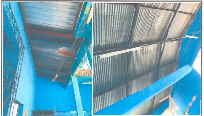
Foto 2: Necesidad de mejoramiento de Techo a Lamina troquelada Calibre 26 y mantenimiento estructura en Modulo 1 de aulas.