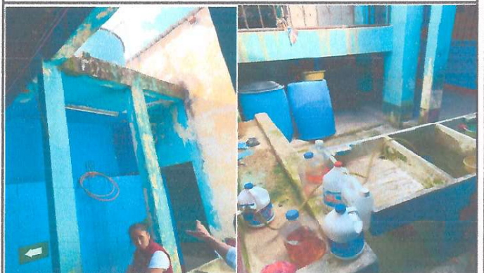
Foto 4: La Comunidad Educativa manifiesta la necesidad de realizar mejoramiento al Tinaco y mejorar base para Lavar manos.