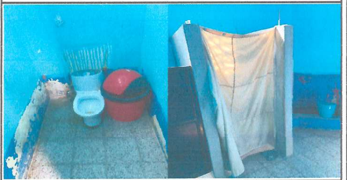
Foto 6 : Necesidad de mejorar los Servicios Sanitarios con Azulejo e instalar-remozar puertas.

Observación: Si es necesario se pueden agregar hojas adicionales y actualizar el número de hojas.